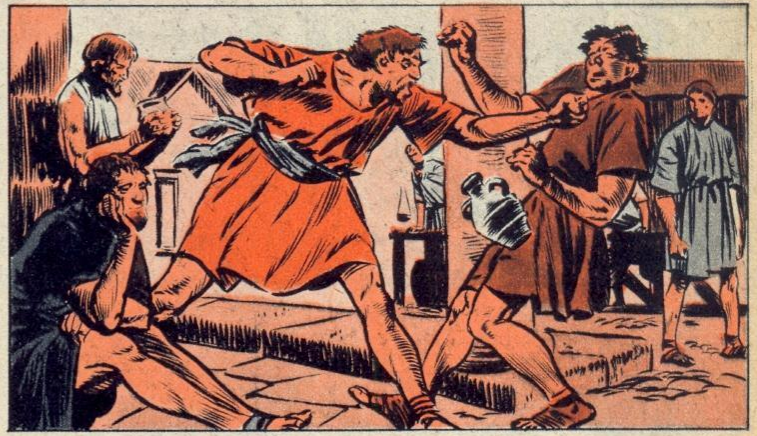
3. - DE NIEUWE ARMEN