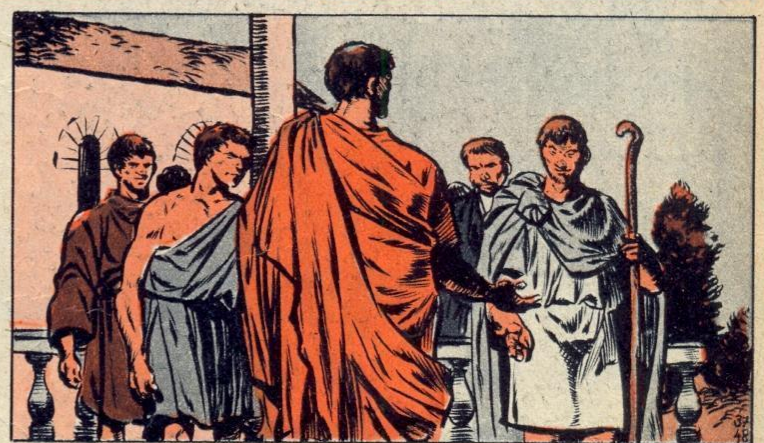
5. - CORRUPTIE

AL wat door Rome onderworpen was moest belastingen betalen. De belasting moest men afgeven aan een kaste van financiers... Deze heren eisten veel meer dan de belasting door de staat geest en zij staken het verschil op zak. Wee de man die niet kon betalen. Al zijn bezittingen werden in beslag genomen en soms kreeg hij zelfs de doodstraf. De belastingontvangers waren ongehoord rijk.