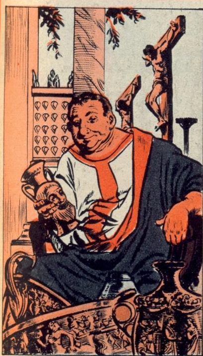
1. - DE PROCONSULS

NAAST nieuwe rijken kwamen er ook nieuwe armen en dat waren de kleine boeren. Het graan kwam uit de provincies en kostte niets. De kleine boeren verkochten hun velden aan rijke grondbezitters, zij waren geruïneerd. Wat deden ze? Ze kwamen naar Rome en vormden een klasse van werklozen en bedelaars.