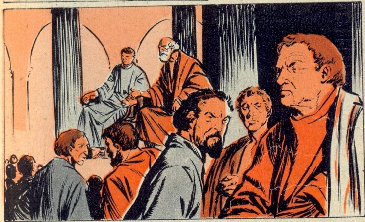
2 - GOUD

CARTHAGO was machtig op zee en Rome had geen oorlogsvloot. Zij moest er dus in allerijl een improviseren. De kunst bestond er in het vijandelijk schip te harpoeneren of te rammen en de bemanning er van te overrompelen. Consul Diulus werd de eerste admiraal van de Romeinse geschiedenis. Dat was in 260 en de consul deed zijn werk goed, want hij versloeg de vloot van Carthago.