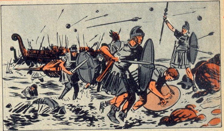
3 - NAAR SICILIE