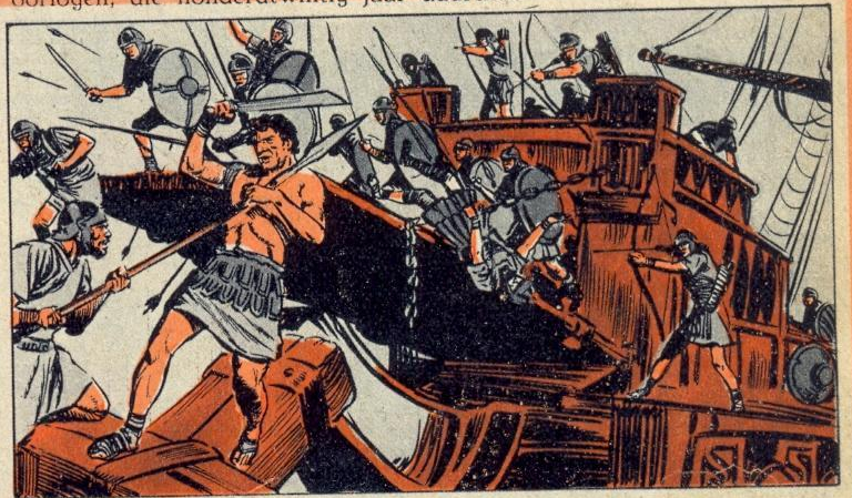
4 - DE EERSTE OVERWINNING

HET was rond het jaar 800 voor Christus dat de Feniciërs (of Puniërs) in Noord Afrika, nabij het huidige Tunis en vlak tegenover Sicilië een kolonie stichtten. Zij noemden deze kolonie Kwarth Hadasht, d.w.z. Nieuwe Stad. De Romeinen maakten er Carthago van. Het duurde niet lang of Carthago was de grootste en de rijkste stad van de wereld, haar oorlogsschepen beheersten de Middellandse Zee en op haar beurt stichtte zij kolonies aan de oevers van de Middellandse Zee. De helft van Sicilië hoorde Carthago toe.