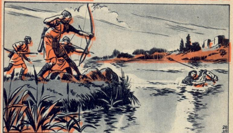
5. - CLELIA

NIET alleen de mannen waren dapper. Er is de geschiedenis van de jonge Clelia, die als gijzelaar werd gevangen gehouden in het kamp van de Etrusken. Zij slaagde er in een paard te bemachtigen en galoppeerde naar de Tiber. Ze sprong er in met haar paard en bereikte onder een regen van pijlen de andere oever. Zij kwam te Rome toe en... de stad werd gered? Neen, helemaal niet! Er verliepen vele jaren vooraleer de Etrusken (of Etruriërs) verdreven werden!