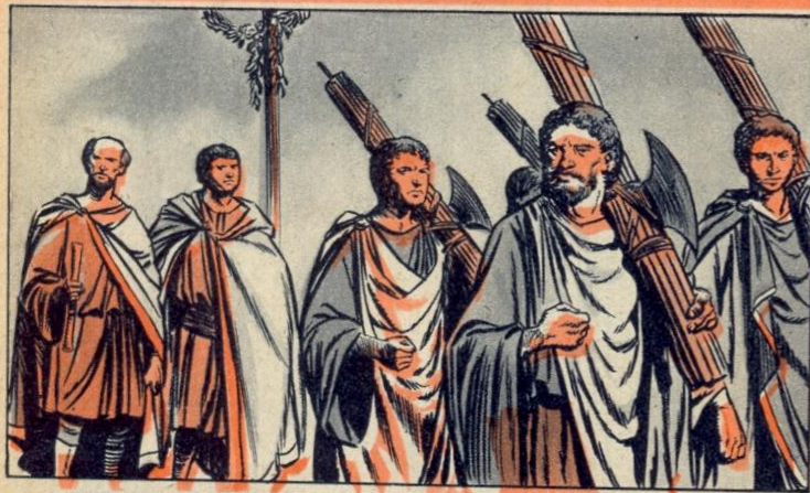
1. - TWEE CONSULS