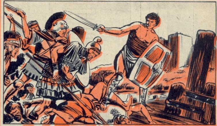
3. - HORATIUS, DE EENOOG

DE republiek was nauwelijks geboren of er werd reeds een samenzwering ontdekt. Jonge patriciërs trachtten koning Tarquinius weer op de troon te zetten. Bij deze samenzweerders waren de twee zonen van consul Brutus betrokken. Zij werden voor het gerecht gebracht en Brutus veroordeelde hen tot de doodstraf. De oudste werd onmiddellijk onthoofd en Brutus beval ook de onthoofding van de jongste. De tweede consul kon het niet aanzien en de senatoren mompelden dat het onmenselijk was. De beul wachtte... Brutus echter bewoog niet. Het heil van de republiek ging voor alles. Het hoofd van de jonge opstandeling rolde in het zand.