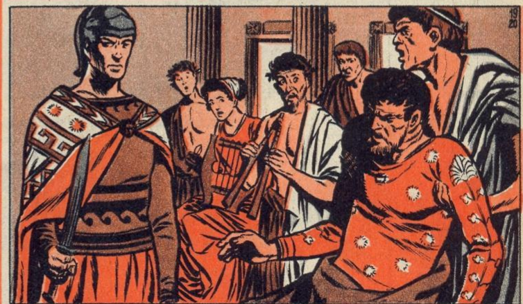
5. — DE DOOD VAN FILIP