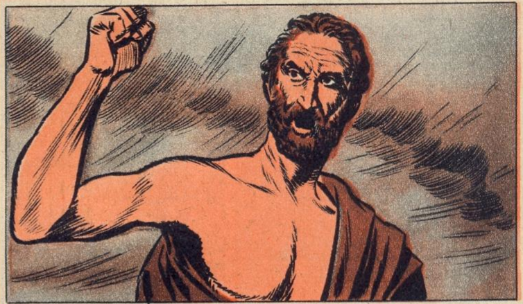
3. — GIJ SLAAPT, VOLK VAN ATHENE!

OM Griekenland te veroveren moest men niet alleen een goed staatsman wezen, men moest ook sterk zijn. Filip was de knapste veldheer van zijn tijd en met hem deed de eigenlijke «krijgstactiek» haar intrede. De Macedonische ruitery kan men de naam van «kavalerie» geven — dit voor het eerst in de geschiedenis — want ze was zeer beweeglijk en werd door Filip als «taktisch» wapen gebruikt. Een detail: stijgbeugels bestonden toen nog niet. Beroemd zijn de 7-meter lange speren of stootlansen. De Middeleeuwse ridders konden hun speren onder de arm klemmen; de Macedoniërs moesten de hunne met de vrije hand bewegen.