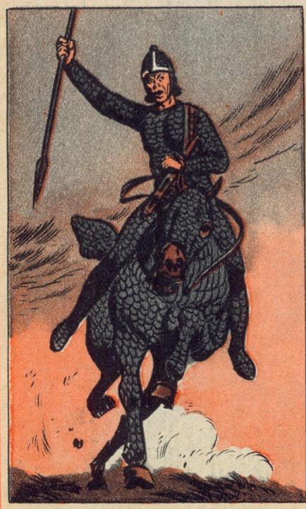
2. — KRIJGSTAKTIJK

ALS kind was Filip in Thebe als gijzelaar gevangen gehouden. Hij kende dus Griekenland en het was zijn droom dit rijk, dat in verval was, uit te bouwen tot een machtige balkanstaat. In Macedonië was de koning niet alleen het staatshoofd, hij was ook rechter, priester en veldheer. Filip had in zijn land de algemene dienstplicht ingevoerd. Dat was iets helemaal nieuws! De andere landen huurden immers soldaten.