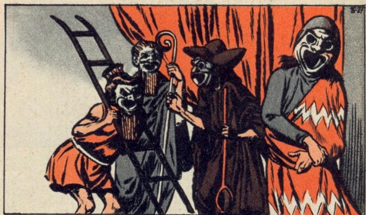
5. - DE BLIJSPELLEN VAN ARISTOPHANES