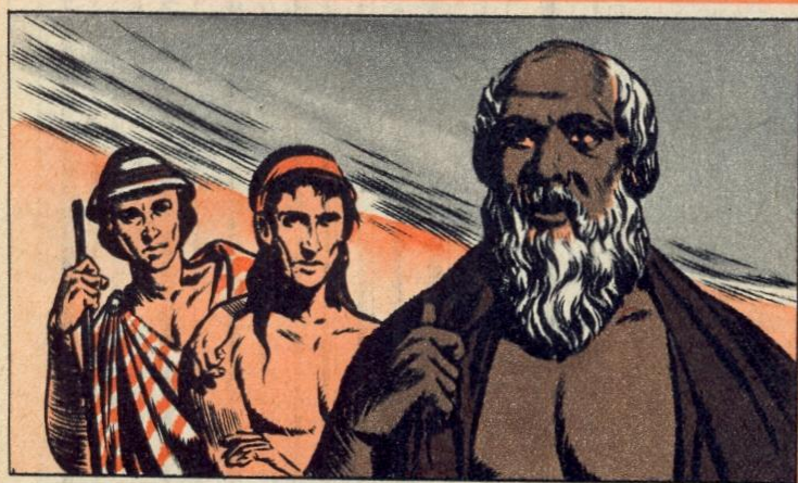
1. - EEN GROOT FILOSOOF

V OORAL het toneel kende een grote bloeiperiode. Het Grieks toneel dankt zijn oorsprong aan de kultus van Dyonisos, god van de wijn. In het begin was het niets anders dan een dialoog van koren. Het Griekse teater was een openluchtteater, gebouwd op de helling van de Akropolis. Het vormde een halve cirkel, het toneel in het midden, en op de trappen konden 30.000 toeschouwers plaats nemen.