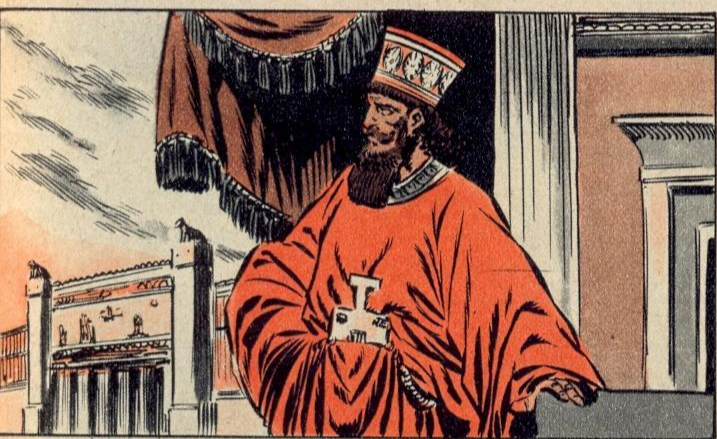
1. — DE KONING DENKT AAN HET VERLEDEN