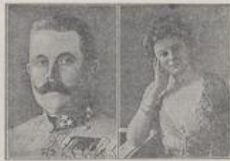
L'archiduc d'Autriche François-Ferdinand et sa femme la duchesse de Habsbourg, assassinés à Sarajevo le 28 juin 1914.

LORSQUE le dimanche 28 juin l'archiduc héritier François-Ferdinand d'Autriche et sa femme, la princesse Sophie, furent assassinés à Sarajevo, il n'est certes pas donné à personne de prévoir que ce simple attentat peut être le prétexte initial à l'événement le plus grand qui verra de même l'Europe à feu et à sang. Le double assassinat de Sarajevo fut l'occasion pour commettre la guerre, mais n'en fut pas la cause. En effet, il est actuellement prouvé, comme nous le verrons, que la déclaration officielle des hostilités de la Grande-Bretagne, qui déclara la guerre à l'Autriche, fut le résultat de la guerre à la Serbie en 1913.