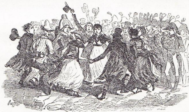
illustration en page 368, clôturant le livre onzième (“ Paix générale ”) de THIERS , Histoire du Consulat et de l'Empire (éd. belge ; 1845, tome premier).

La paix de la France était faite avec toutes les puissances de la terre. Il restait une seule paix à conclure, plus difficile peut-être que les précédentes, car elle exigeait un tout autre génie que celui des batailles, et elle était fort désirable aussi, puisqu'elle devait rétablir le repos dans les âmes, l'union dans les familles. Cette paix était celle de la République avec l'Église. Le moment est donc venu de raconter les négociations laborieuses dont elle était l'objet avec le représentant du Saint-Siège.