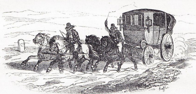
illustration en page 256, clôturant le livre septième (" Hohenlinden ") de THIERS , Histoire du Consulat et de l'Empire (éd. belge ; 1845, tome premier).

Le général Bellavène, chargé de porter le traité, partit de Lunéville le 9 février au soir, et arriva en courrier extraordinaire à Paris. Le texte même du traité qu'il apportait fut inséré immédiatement au Moniteur . Paris fut soudainement illuminé; une joie vive et générale éclata de toute part; on rendit mille actions de grâces au Premier Consul, pour cet heureux résultat de ses victoires et de sa politique.