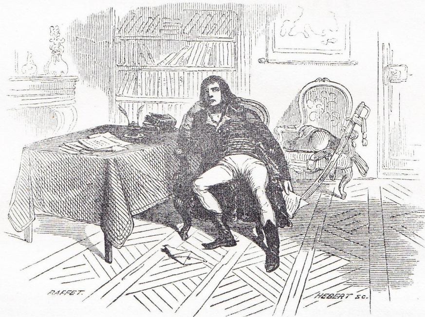
illustration en page 113, clôturant le livre troisième (“ Ulm et Gênes ”) de THIERS , Histoire du Consulat et de l'Empire (éd. belge ; 1845, tome premier).

Il faut nous transporter maintenant sur un théâtre différent, pour y être témoins d'un spectacle fort différent aussi : la Providence, si riche en contrastes, va nous montrer un autre esprit, un autre caractère, une autre fortune, et, pour l'honneur de notre pays, des soldats toujours les mêmes, c'est-à-dire toujours intelligents, dévoués et intrépides.