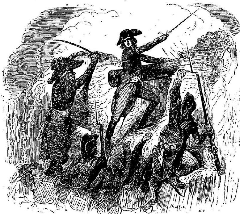
Paris, S. Raçon et C e , imp.

six pièces du fort, et les contraignirent à la retraite. Cette affaire nous coûta mille hommes, et deux mille cinq cents aux ennemis. Il restait à s'emparer d'un point très-important, le fort Malbousquet; mais sa prompte évacuation épargna aux nôtres les dangers d'une nouvelle attaque. Sans perdre de temps, Bonaparte fit pointer sur la rade les batteries du Petit-Gibraltar , disposition qui décida les alliés à se rembarquer. « Demain ou après-demain au plus tard, avait-il dit aux représentants, vous souperez dans Toulon. »