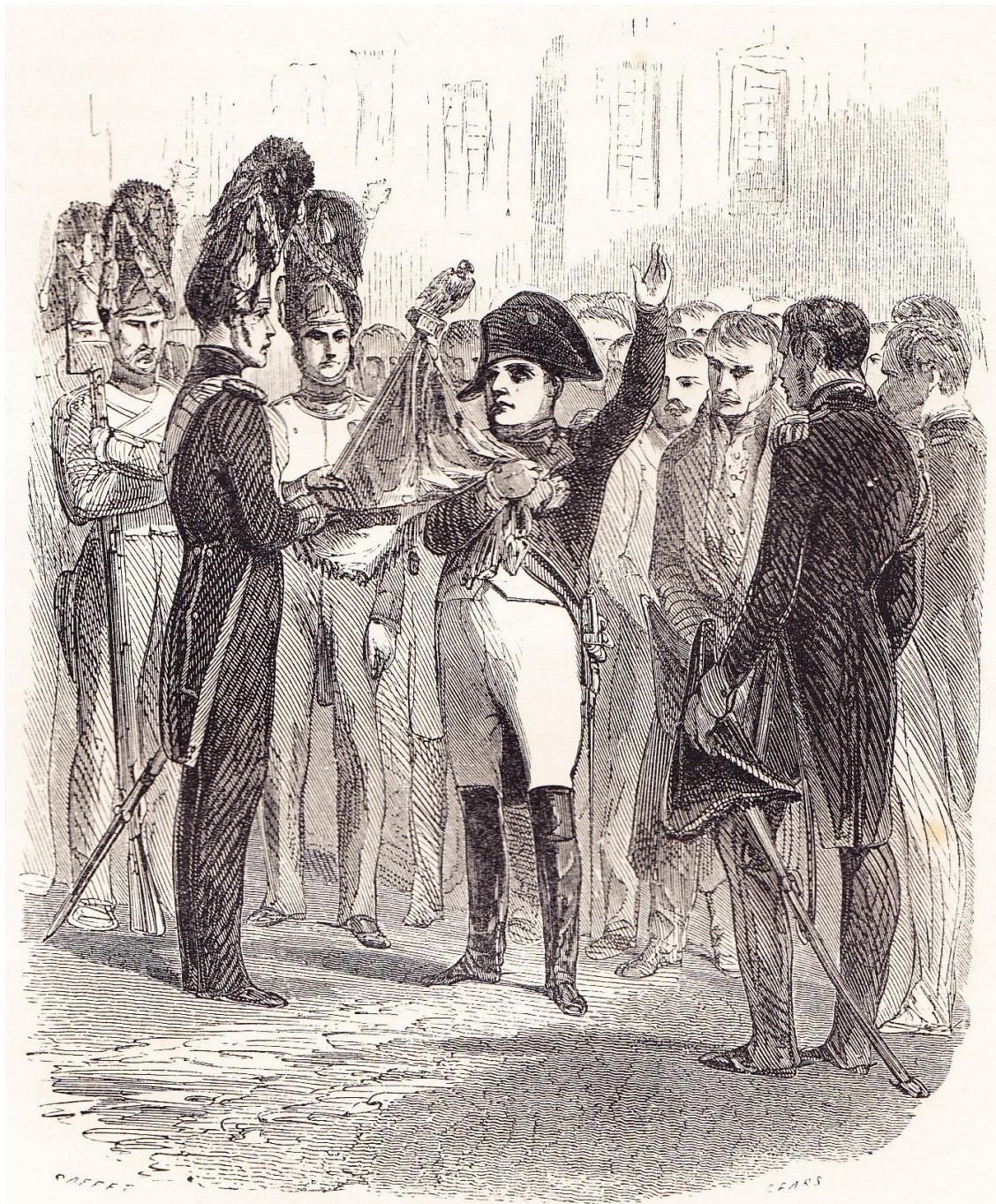
Adieux de Fontainebleau

“ Adieux de Fontainebleau ”, hors texte entre les pages 552 et 553 de NORVINS , Histoire de Napoléon (éd. belges de 1839 et 1841).