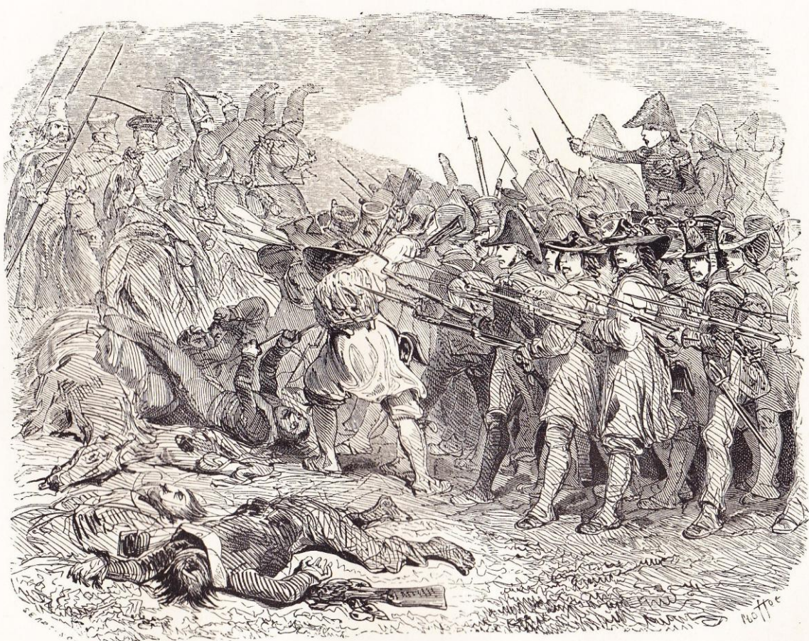
Combat de Fère-Champenoise.

“ Combat de Fère-Champenoise ”, illustration horizontale , hors texte entre les pages 538 et 539 de NORVINS , Histoire de Napoléon (éd. belges de 1839 et 1841).