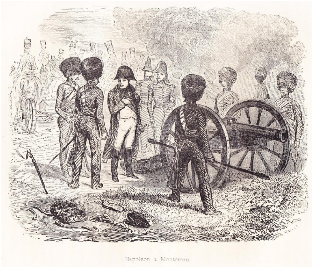
Napoleon à Montereau.

“ Napoléon à Montereau ”, illustration horizontale , hors texte entre les pages 528 et 529 de NORVINS , Histoire de Napoléon (éd. belges de 1839 et 1841).