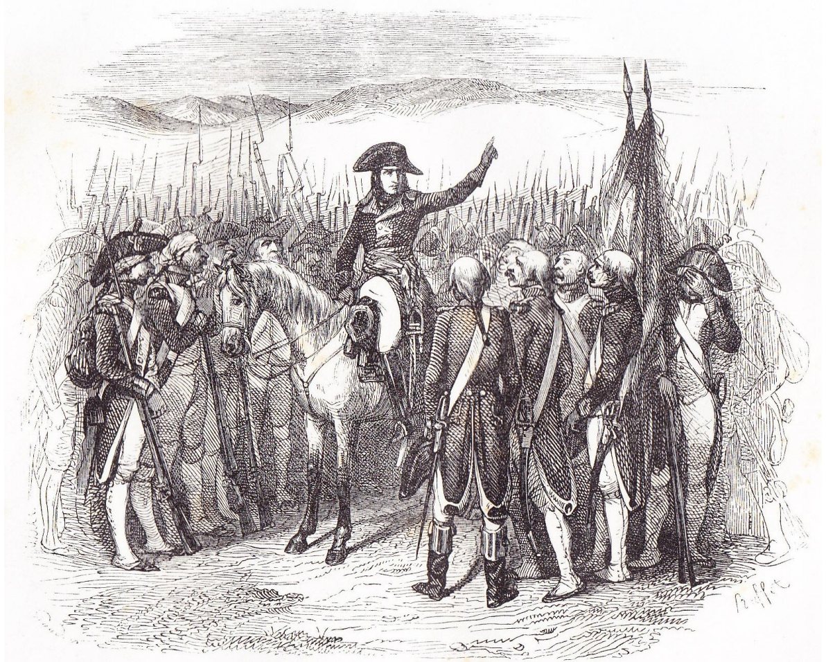
Allocution à la division Vaubois sur le plateau de Rivoli. (Novembre 1796.)

“ Allocution à la division Vaubois sur le plateau de Rivoli (novembre 1796) ”,