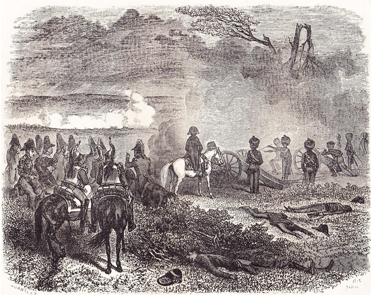
Mort de Moreau.

“ Mort de Moreau ” (devenu conseiller du tsar Alexandre 1er, à la suite de la bataille de Dresde du 27 août 1813),