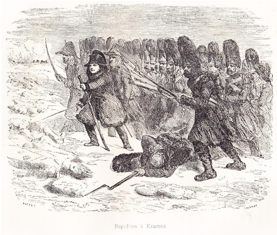
“Napoléon à Krasnoë”, illustration horizontale, hors texte entre les pages 448 et 449 de NORVINS , Histoire de Napoléon (éd. belges de 1839 et 1841).