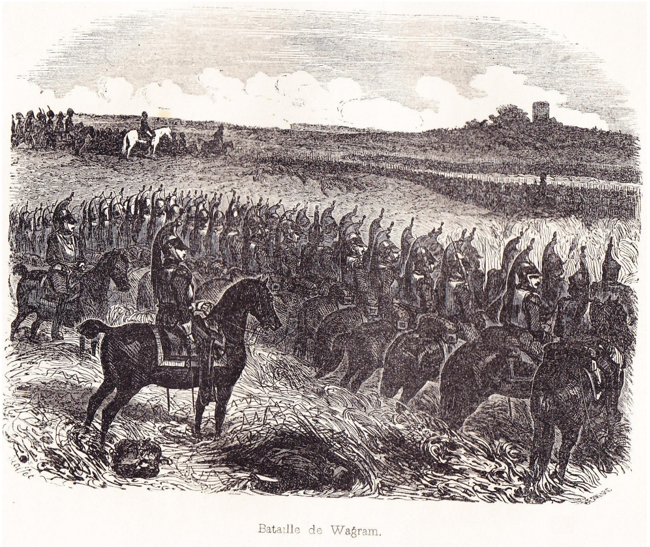
Bataille de Wagram.

“ Bataille de Wagram ”, illustration horizontale , hors texte entre les pages 396 et 397 de NORVINS , Histoire de Napoléon (éd. belges de 1839 et 1841).