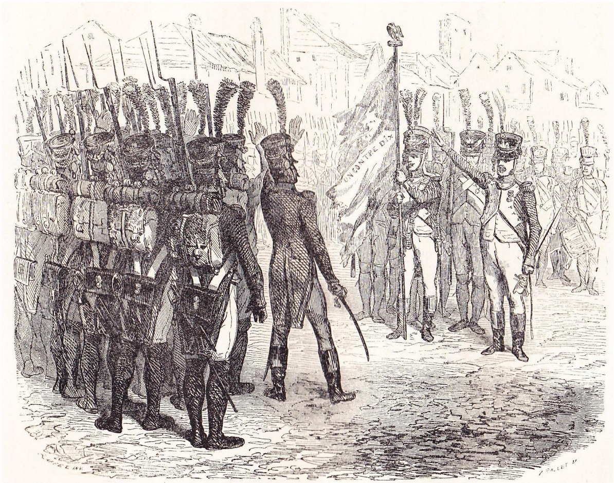
Le Drapeau du 84 e régiment : Un contre dix.

“Le drapeau du 84 ème régiment : un contre dix”, illustration horizontale , hors texte entre les pages 388 et 389 de NORVINS , Histoire de Napoléon (éd. belges de 1839 et 1841).