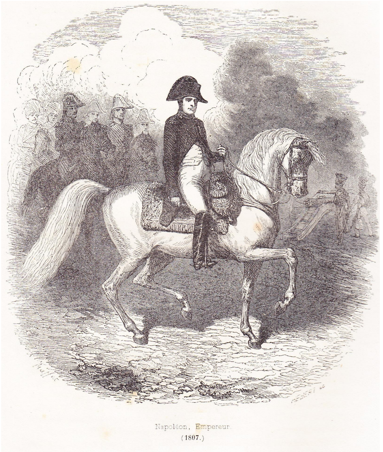
Napoléon, Empereur. (1807.)

“ Napoléon empereur (1807) ”, hors texte entre les pages 320 et 321 de NORVINS , Histoire de Napoléon (éd. belges de 1839 et 1841).