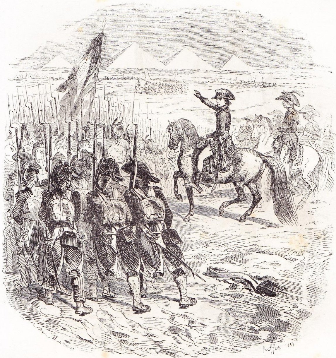
Bataille des Pyramides. (10 juillet 1798.)

“ Bataille des pyramides (10 juillet 1798) ”, premier de 2 hors texte entre les pages 146 et 147 de NORVINS , Histoire de Napoléon (éd. belges de 1839 et 1841).