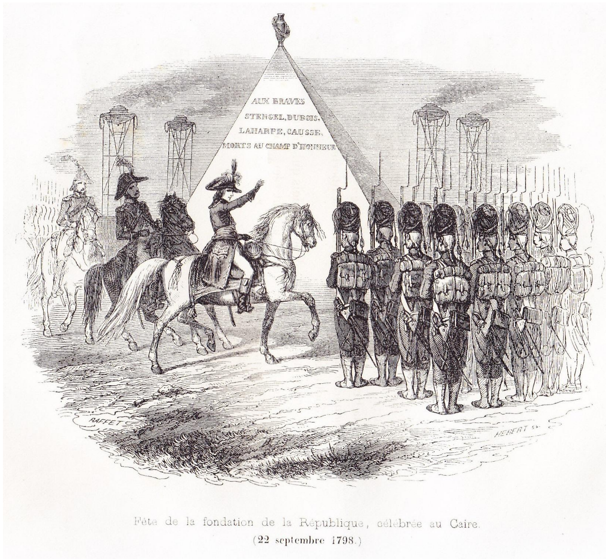
Fête de la fondation de la République, célébrée au Caire. (22 septembre 1798.)

“Fête de la fondation de la République célébrée au Caire (22 septembre 1798)” , illustration horizontale , hors texte entre les pages 118 et 119 de NORVINS , Histoire de Napoléon (éd. belges de 1839 et 1841).