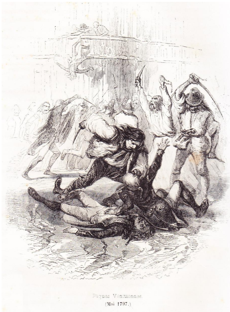
“ Pâques vénitiennes (mai 1797) ”, illustration horizontale , hors texte entre les pages 112 et 113 de NORVINS , Histoire de Napoléon (éd. belges de 1839 et 1841).