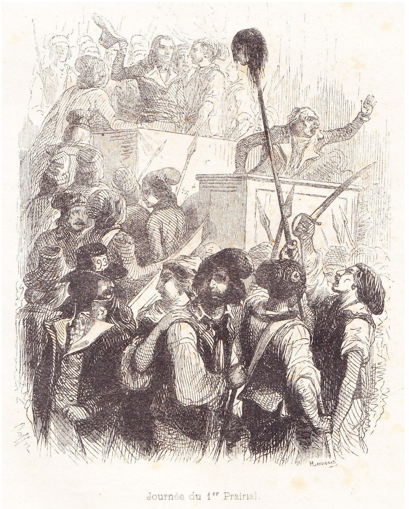
Journée du 1 er Primal.