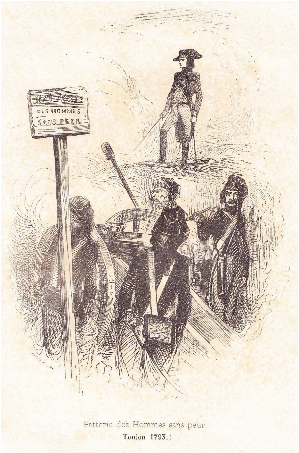
Batterie des Hommes sans peur.