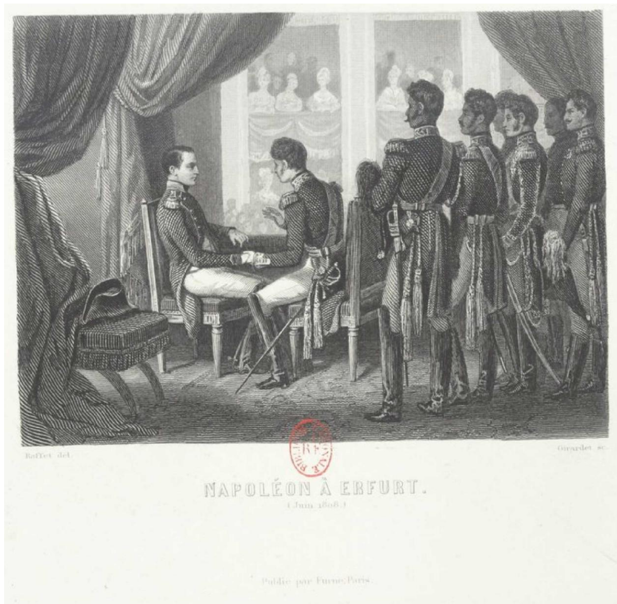
“Napoléon à Erfurt”, illustration horizontale, regravée ( ? ), dans THIERS , Vignettes et portraits pour le Consulat et l'Empire (1845)