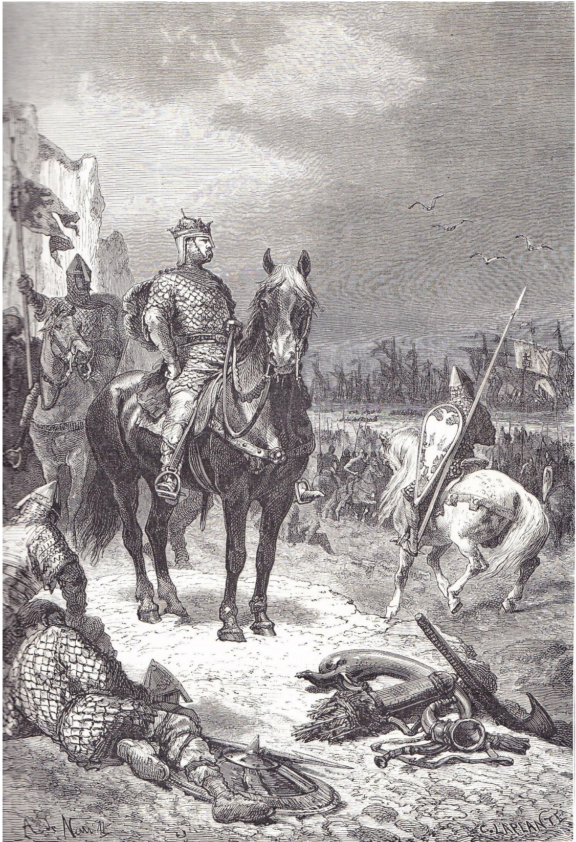
DÉBARQUEMENT DE GUILLAUME LE CONQUÉRANT SUR LES CÔTES D'ANGLETERRE

« débarquement de Guillaume le conquérant sur les côtes d'Angleterre »