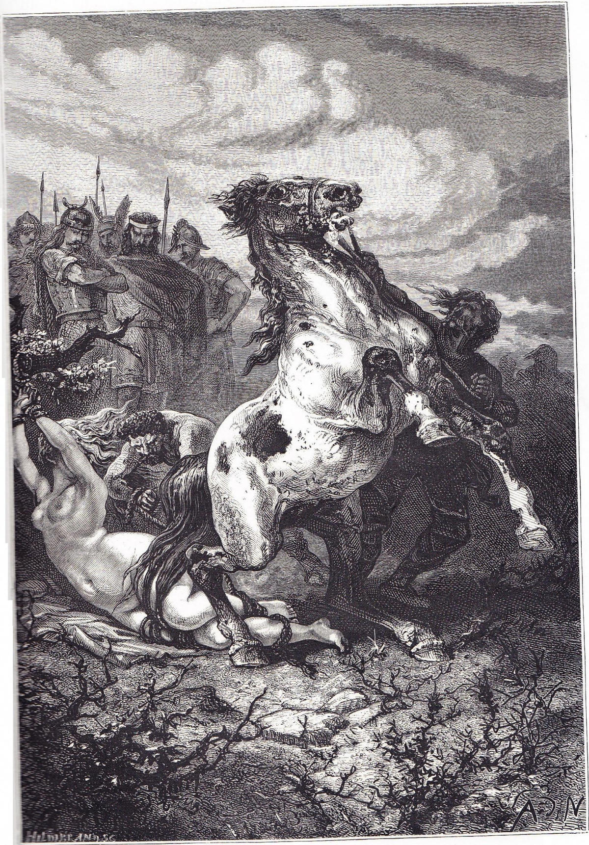
SUPPLICE DE BRUNHAUT