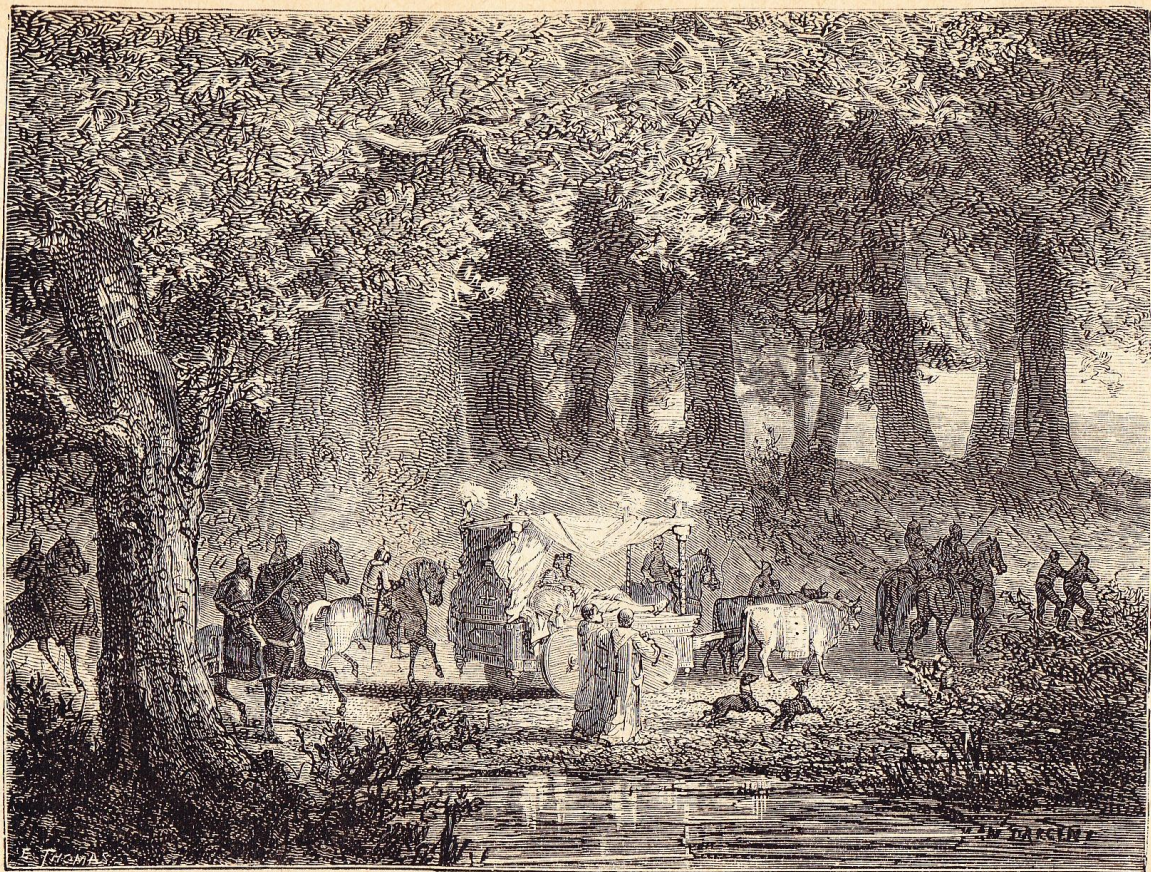
Roi fainéant sur son char à bœufs.

https://ia601404.us.archive.org/10/items/histoiredfran01mart/histoiredfran01mart.pdf