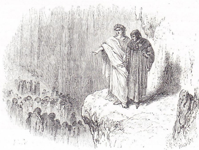
(Le poète Virgile et Dante)