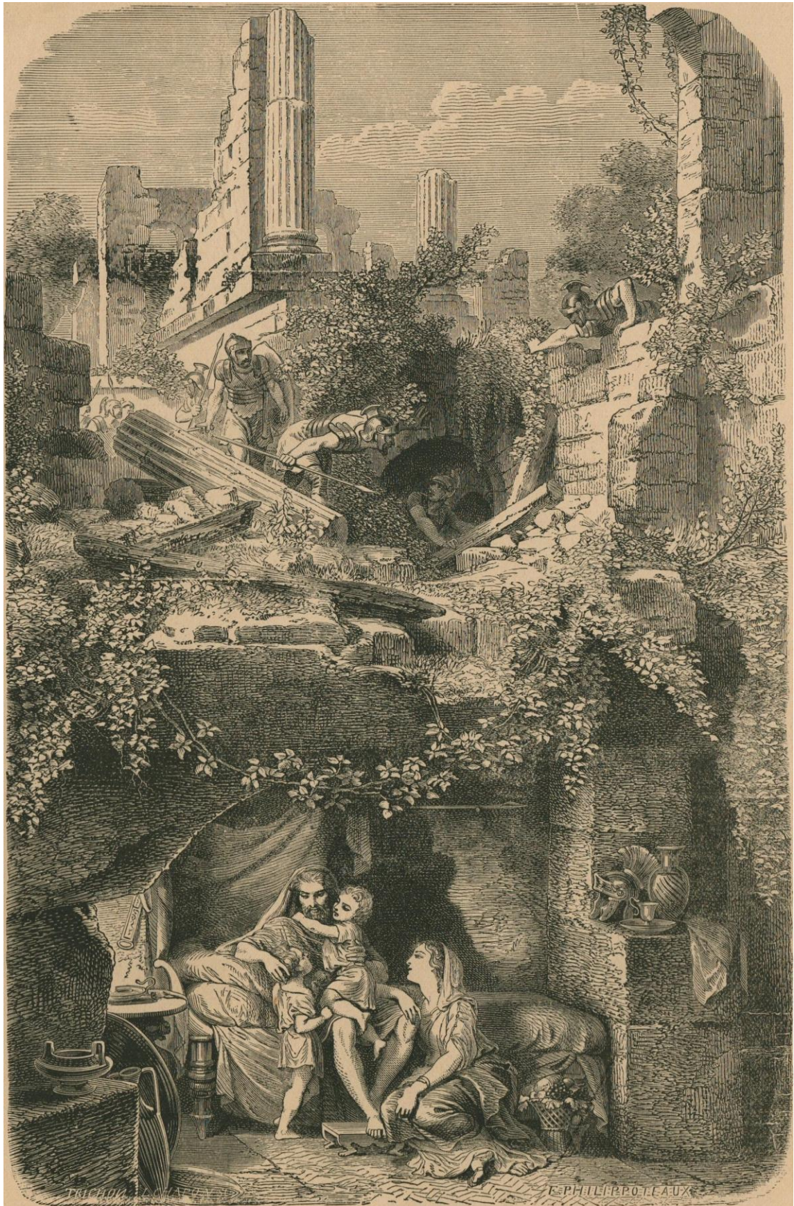
25. — Légionnaires romains découvrant la retraite de Sabinus et d'Eponine sous les ruines de leur villa. Romeinsche soldaten ontdekken de schuilplaats van Sabinus en Eponine onder de puinen van hunne villa.