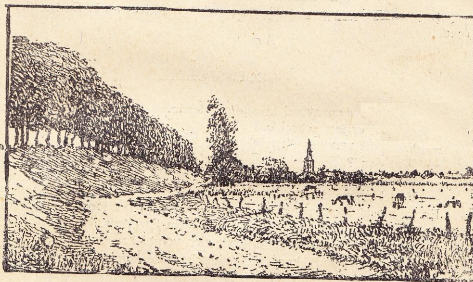
Machtige dijken beschermen de polders

— Maar dat kan niet... En ik heb den plicht voor de openbare veiligheid te waken.