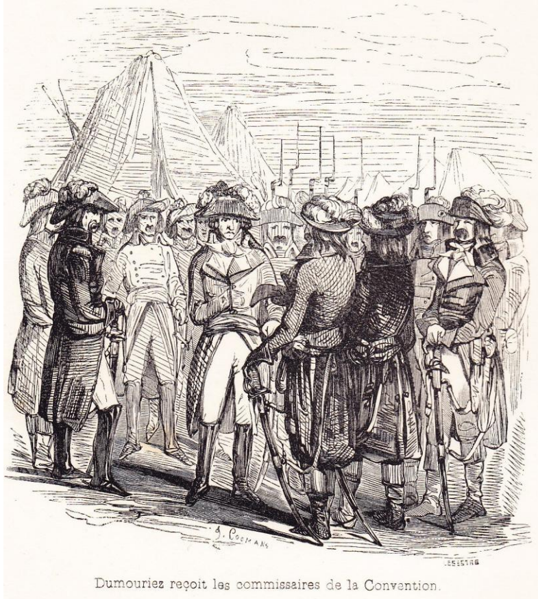
Dumouriez reçoit les commissaires de la Convention.

“Travaux exécutés au Champ-de-Mars pour la fédération”