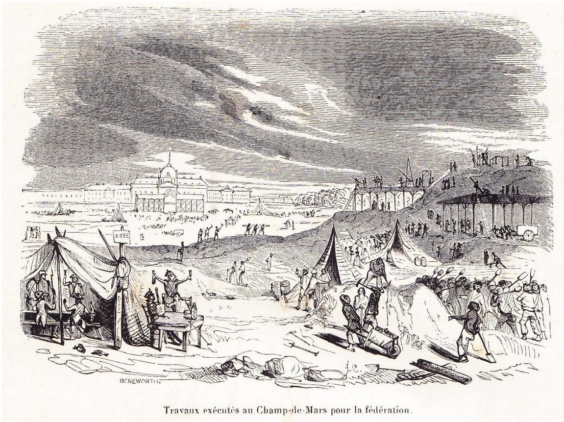
Travaux exécutés au Champ-de-Mars pour la fédération.

“Travaux exécutés au Champ-de-Mars pour la fédération”