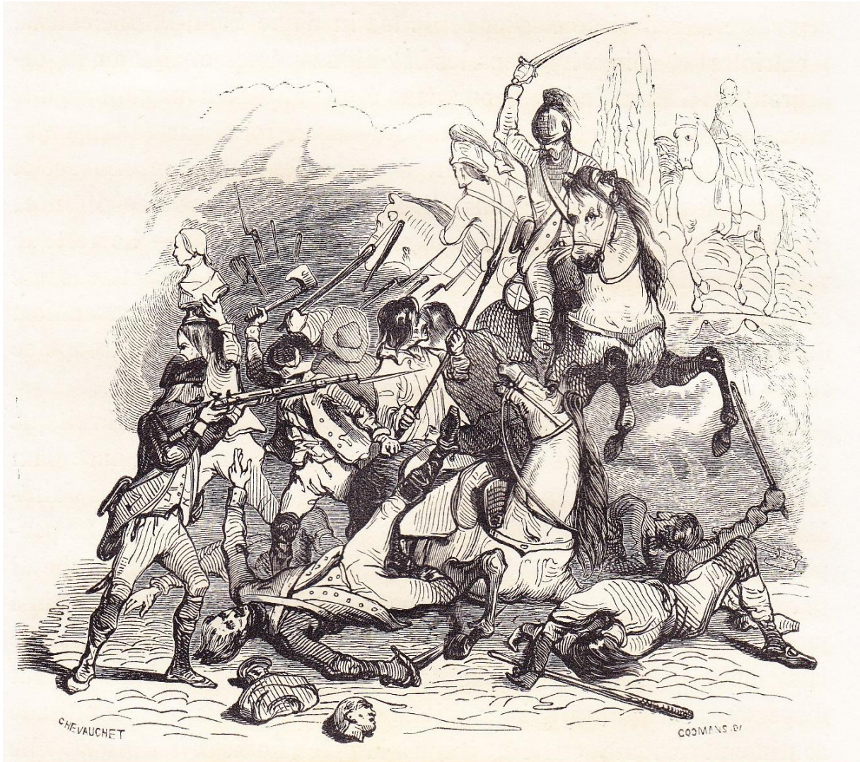
Charge des dragons ("Royal-Allemand") du prince de Lambesc à la place Vendôme le 12 juillet 1789.