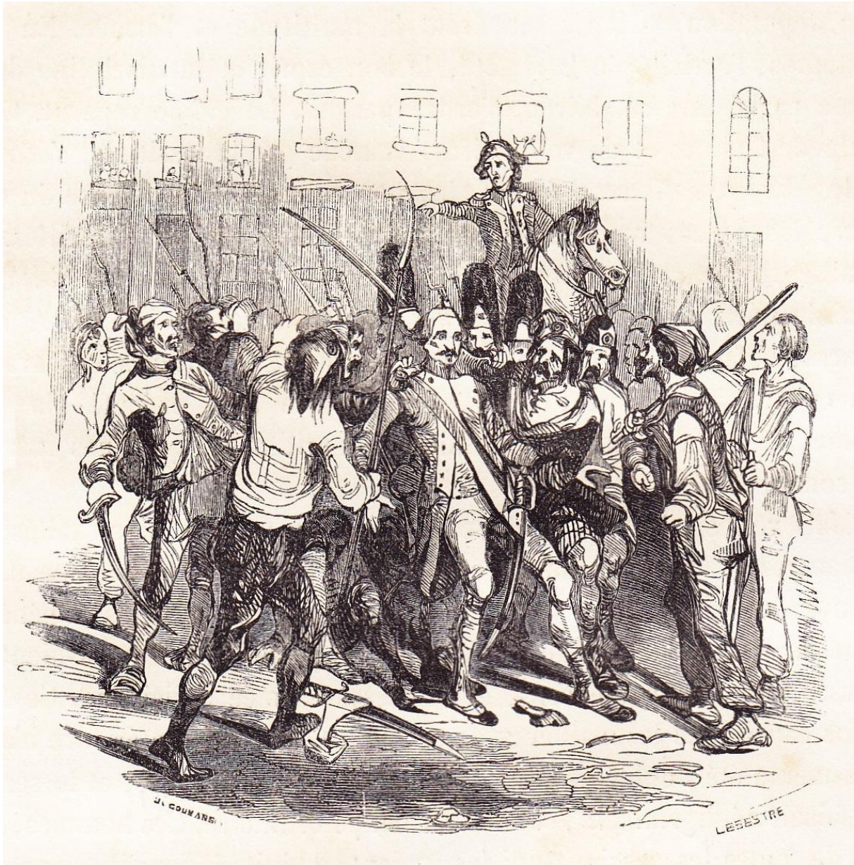
“gardes du corps sauvés par les gardes-françaises au château de Versailles” (octobre 1789)