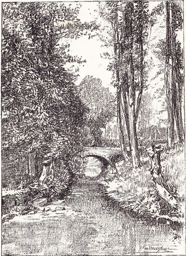
Le Pont du ruisseau à Biesthoek.

chemin le long du ruisseau : à chaque pas, de petits ponts qui servent de passage à des habitations du plus pittoresque aspect. Elles sont parfois tellement vieilles qu'elles vous font songer