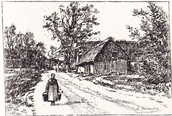
Rue à Maleyzen.

millésime 1845, se trouve un chemin qui permet de gagner la gare de La Hulpe en quinze minutes si l'on prend le sentier à travers champs. On peut aussi suivre l'unique rue du village jusqu'à l'église de Maleyzen et prendre la grand'route d'Over-