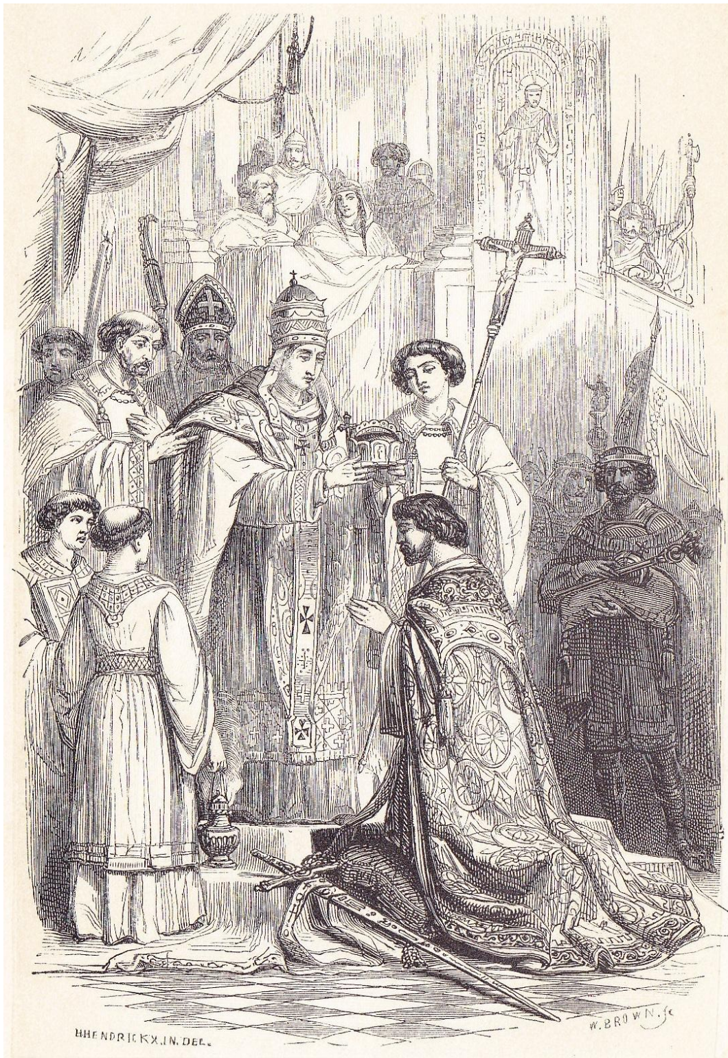
Couronnement de Charlemagne.

“ Couronnement de Charlemagne ”, In Th. JUSTE , Histoire de Charlemagne (1846)