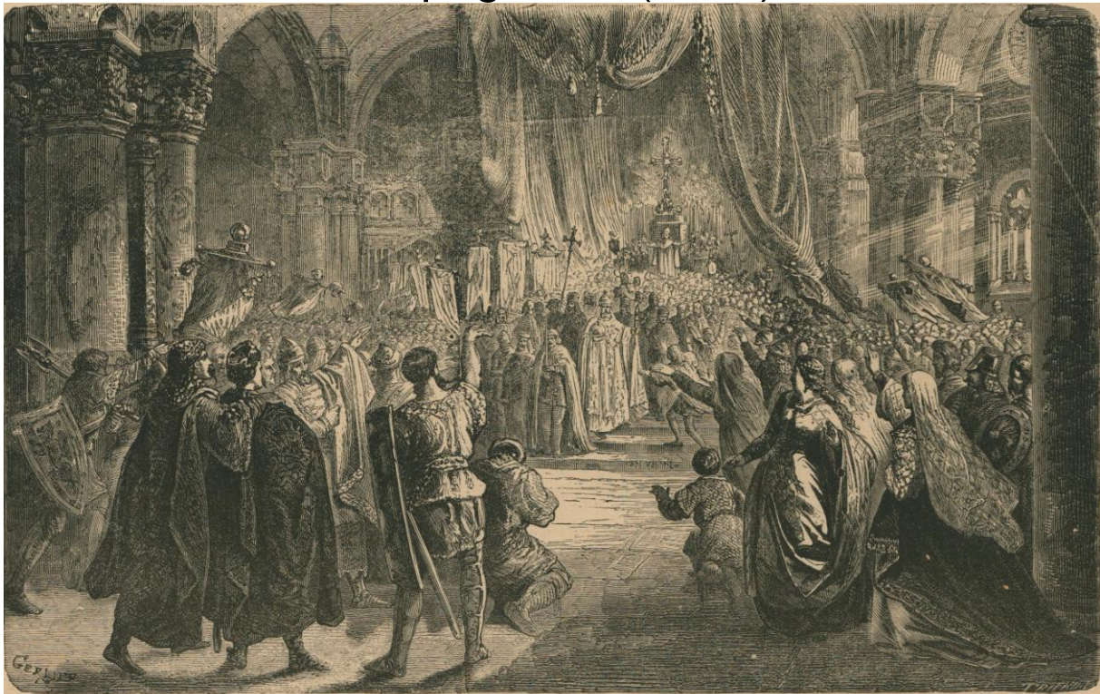
46. — Charlemagne couronné empereur d'Occident, à Rome, par le pape Léon III, le jour de Noël de l'an 800. Karel de Groot, te Rome, door den paus Leo III, keiser van het Westen gekroond, op Kerstdag van het jaar 800.