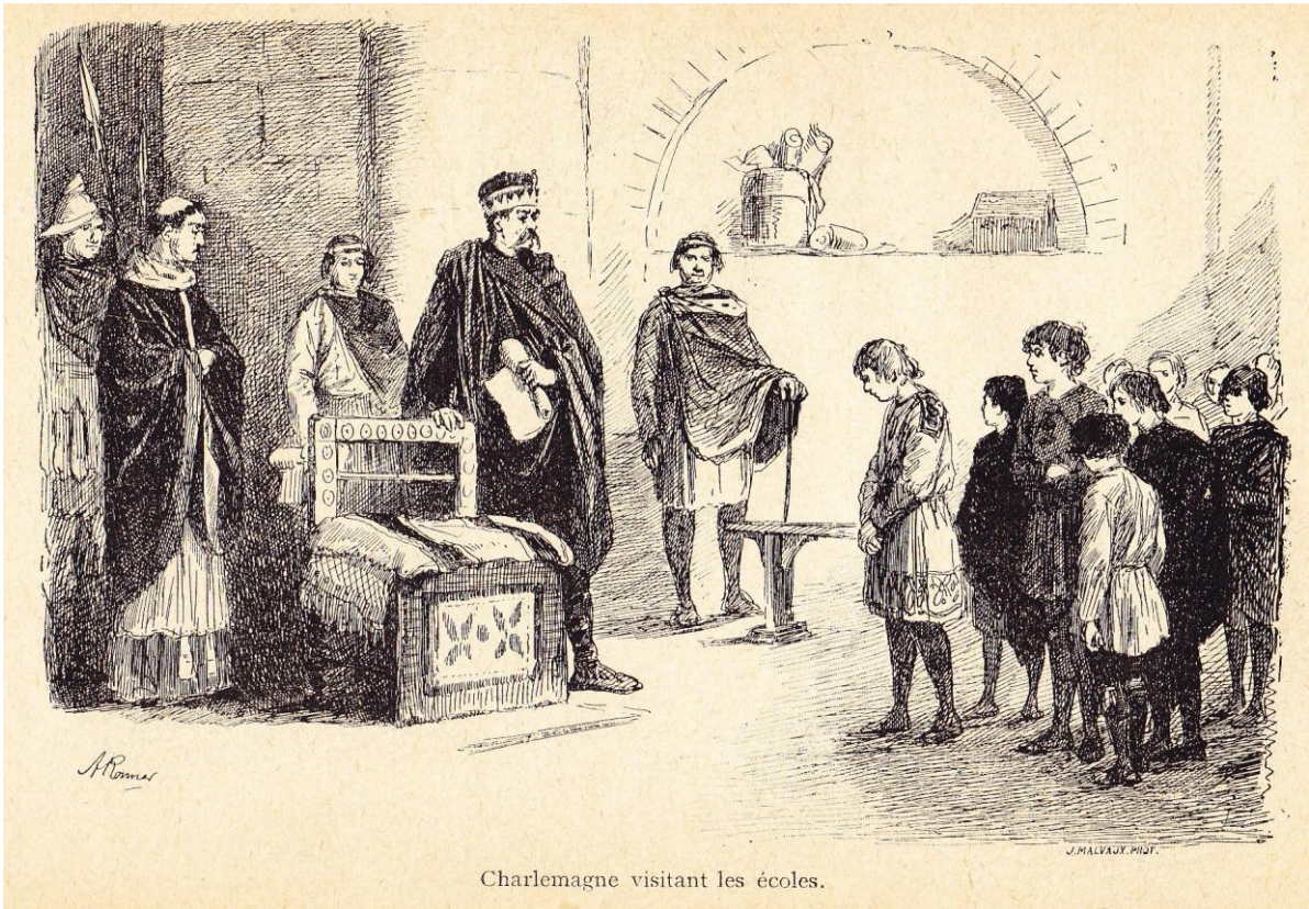
Charlemagne visitant les écoles.

in Abrégé de l'histoire de Belgique , en page 44.