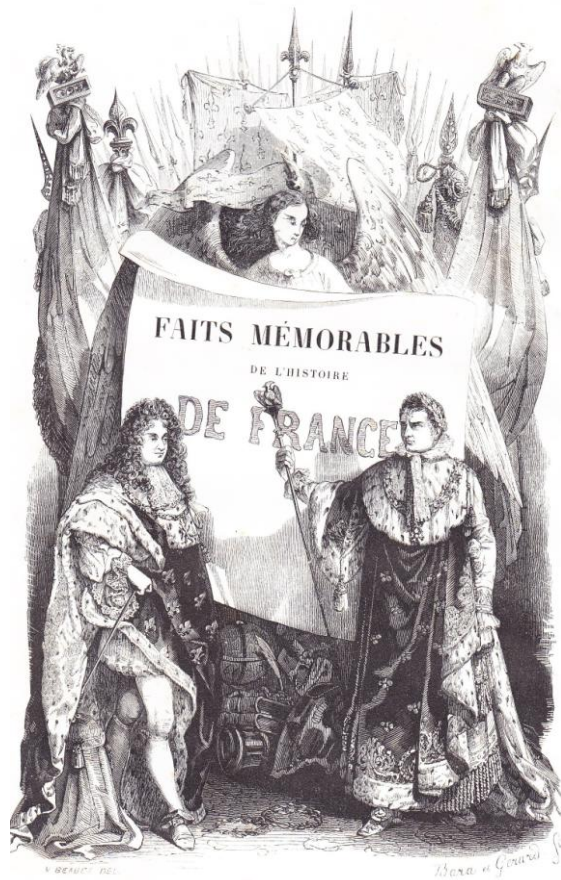
Frontispice de Beaucé d'après Barat et Gérard.