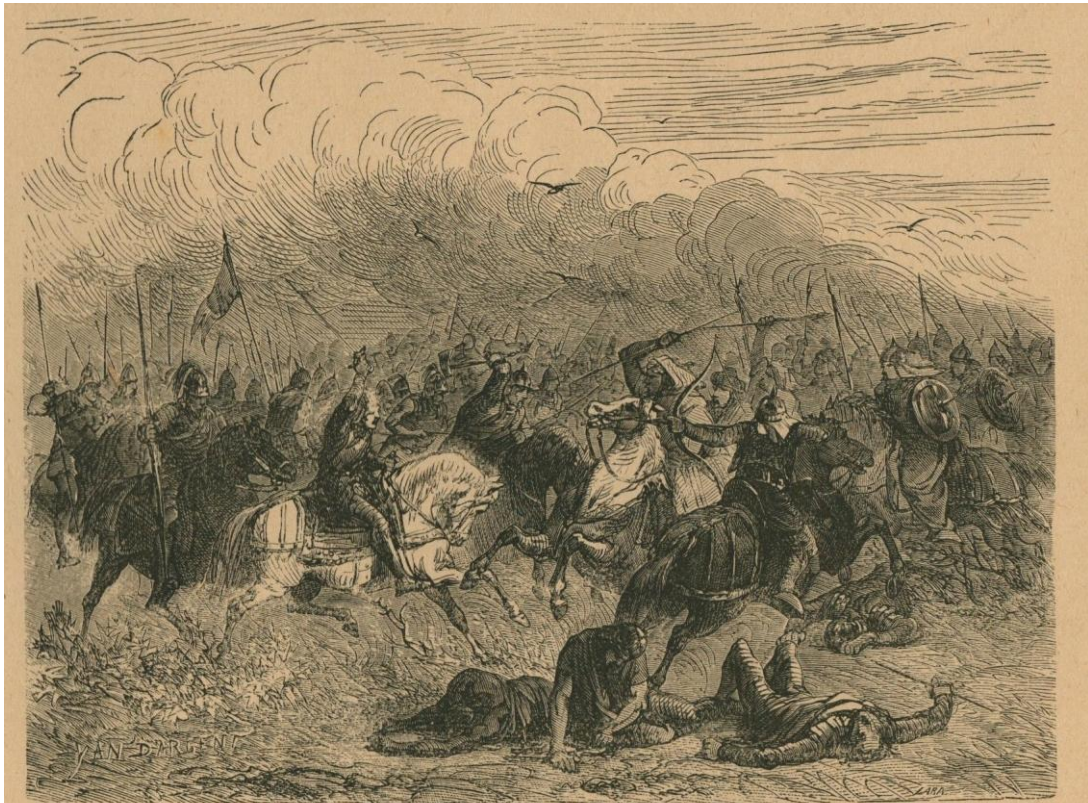
36. — Charles-Martel, duc d'Austrasie, défait les Arabes conduits par Abdérame, à la bataille de Poitiers (octobre 732).

Karel-Martel, hertog van Austrasië, verslaat de Arabieren door Abderama aangevoerd, in den veldslag bij Poitiers (October 732).