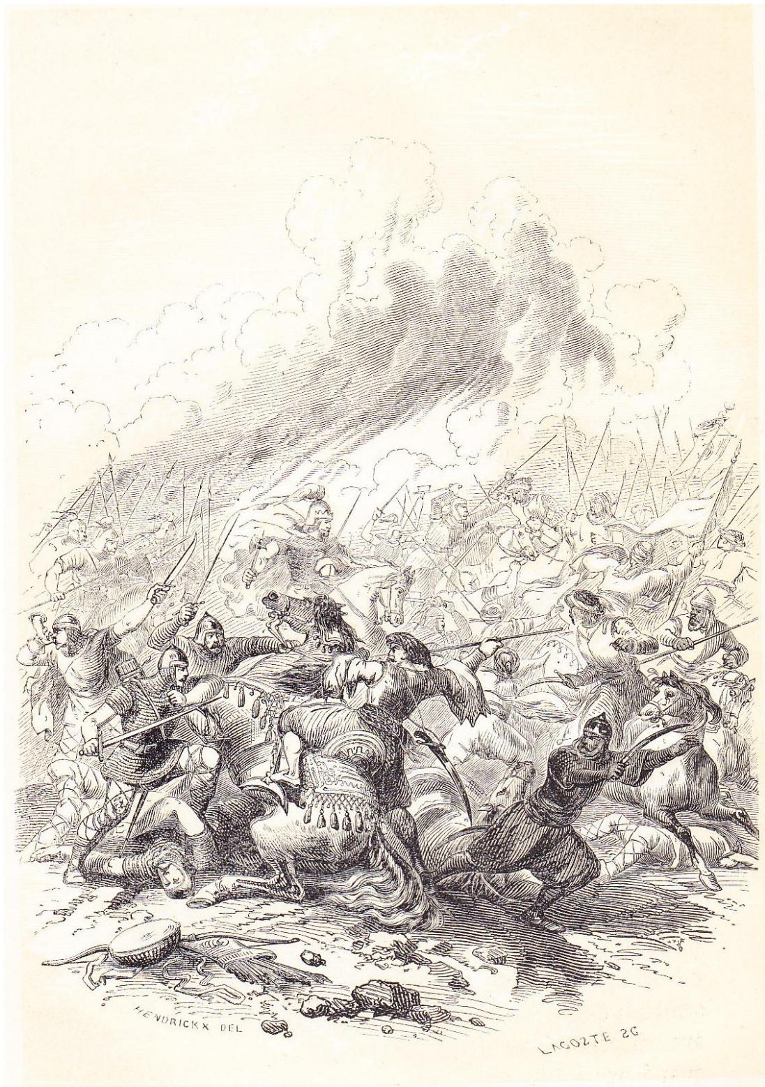
Bataille de Poitiers

“Bataille de Poitiers” , In Histoire des rois francs (1846, tome II)