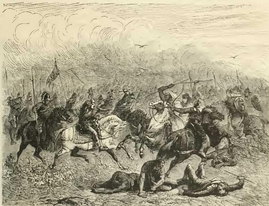
Charles Martel et Abdérame à la bataille de Poitiers.

goths en Gaule. En 721, ils se jetèrent sur l'Aquitaine et assiégèrent Toulouse.