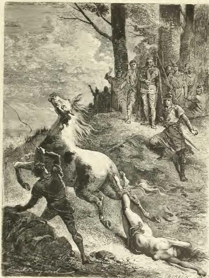
Supplice de Brunehaut.

traire, ne voulaient point, pour la plupart, la victoire de Brunehaut, parce qu'elle lâchait de rétablir les lois et coutumes romaines, haïes de tous les Germains.