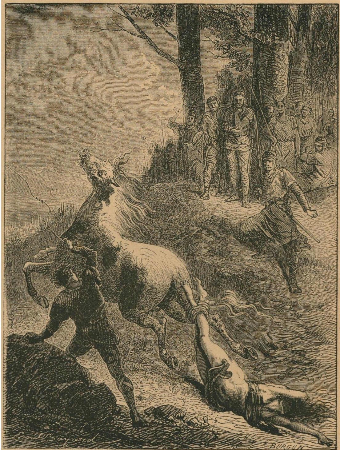
34. — La reine d'Austrasie Brunehaut, tombée aux mains de Clotaire II, fils de Frédégonde, est attachée à la queue d'un cheval indompté (613). Brunehilde, koningin van Austrasië, in de handen van Clotaire II, zoon van Fredegonde, gevallen, wordt aan den staart van een ongetemd paard vastgebonden (613).

reproduit dans SEVERIN , Histoire de la Belgique en images , à la page 14