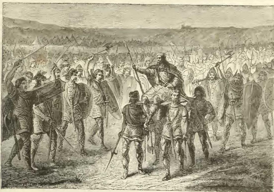
Sigebert élevé sur le bouclier.

elle fit jeter au feu, par le roi, les registres des impôts.