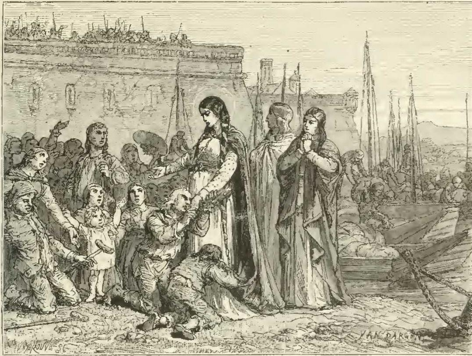
Sainte Geneviève secourant Paris assiégé.

ariens, eux avaient gardé le culte d'Odin, une religion où l'on ne prêchait que la vertu guerrière, et où le bonheur des héros, dans l'autre vie, consistait à boire, à se battre, à chasser et à écouter des chansons de guerre jusqu'à la fin des temps.