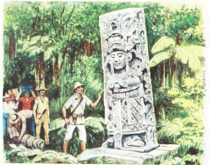
La stèle découverte par Stephens au plus profond d'une forêt du Yucatan. De ses étranges sculptures et des inscriptions qui la recouvrent, aucune explication ne pouvait encore être donnée.

On a constaté des ressemblances entre les Temples maya et les Temples aztèques. Dans les uns et les autres on célébrait des cérémonies qui présentaient de grandes analogies. On y adorait une même divinité mons-