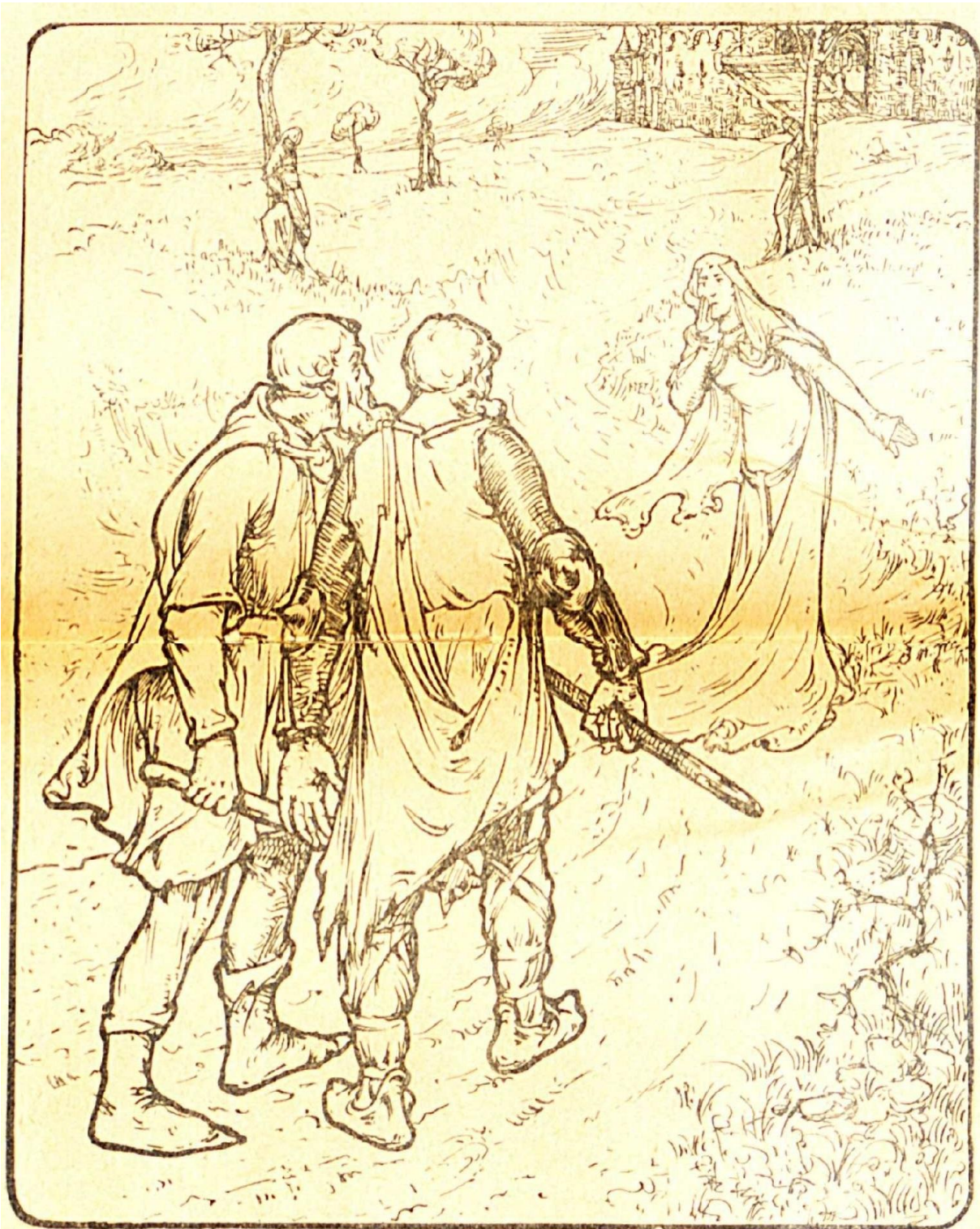
Vol afschuw wende Mathilda zich af... (blz. 203)