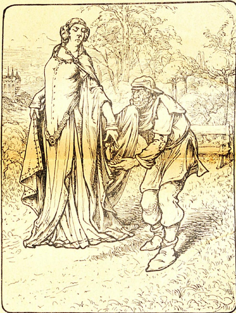
...hij nam den lederen buidel aan, en kuste het kleed der Fransche. (blz. 153)

Illustraties die in onze vorige artikels nog niet aanwezig waren / illustrations pas encore présentes dans nos articles précédents