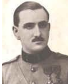
Photo publiée avec l'aimable autorisation du - Foto gepubliceerd met toestemming van de

http://www.bel-memorial.org/photos/TEURLINGS_Jules_2895.htm