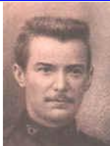
Photo publiée avec l'aimable autorisation du - Foto gepubliceerd met toestemming van de

http://www.bel-memorial.org/photos/CERIEZ_Marcel_2850.htm