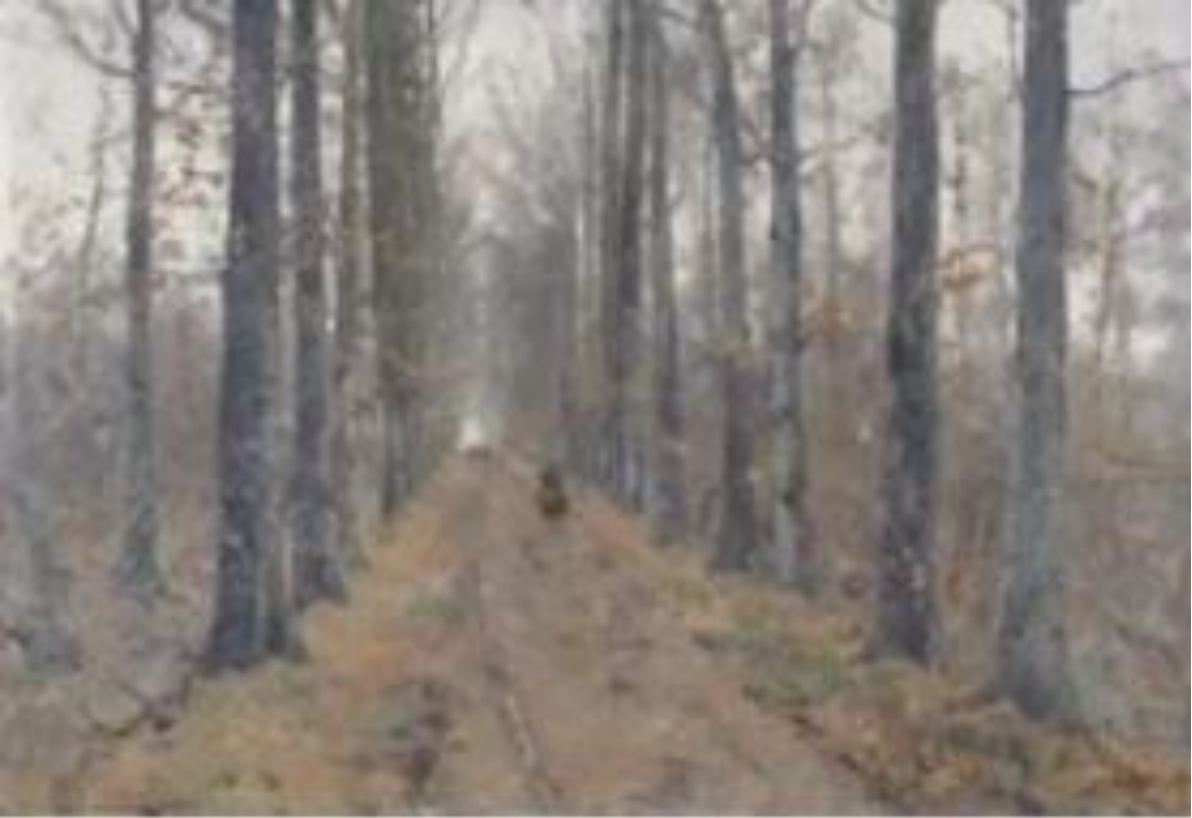
Forêt de Soignes