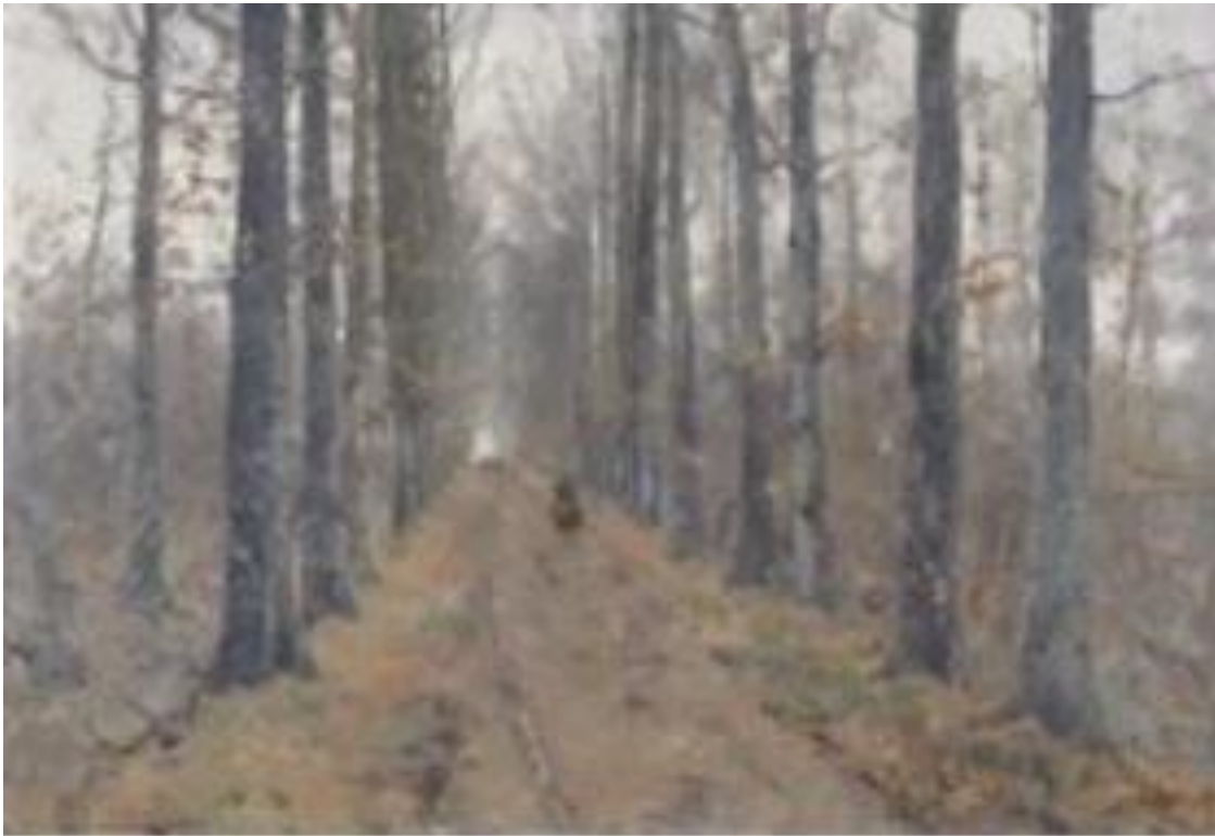
Forêt de Soignes

Adolphe HAMESSE peignait aussi mais son talent fut longtemps méconnu. En voici un échantillonnage : « Forêt de Soignes », « Arbre », « Automne », « Paysage », « Le moulin à eau ».