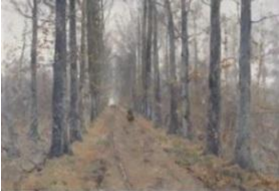
Forêt de Soignes

Adolphe HAMESSE peignait aussi mais son talent fut longtemps méconnu. En voici un échantillonnage : « Forêt de Soignes », « Arbre », « Automne », « Paysage », « Le moulin à eau ».