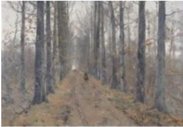
Forêt de Soignes