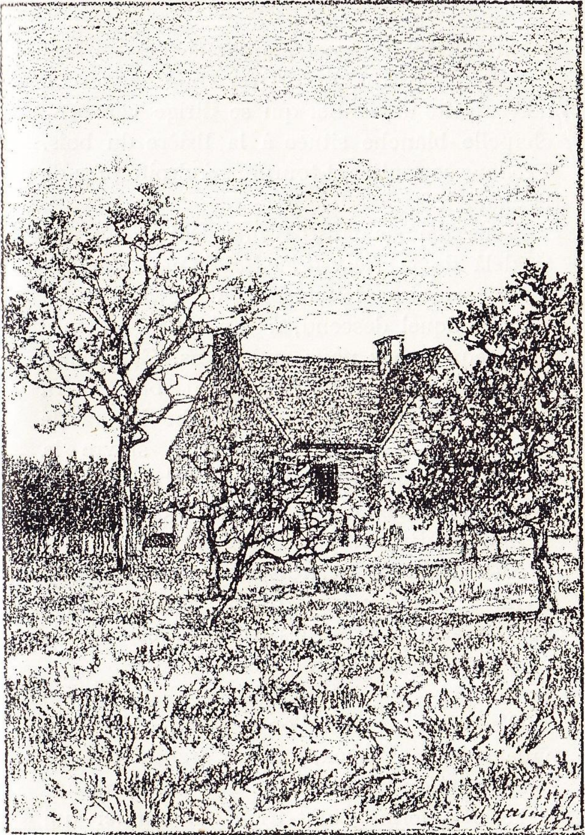
La ferme Saint-Éloy.