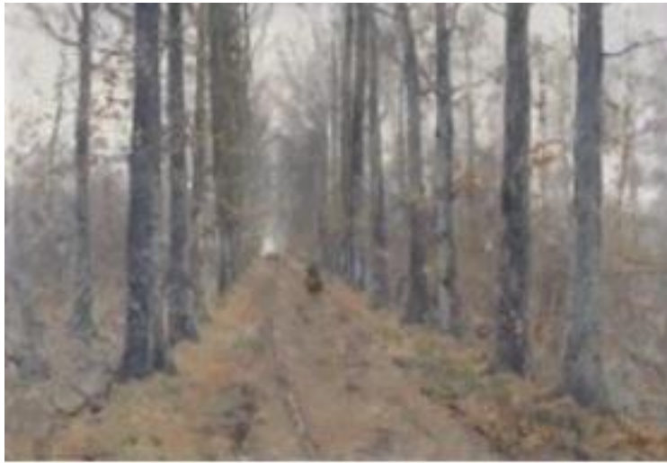
Forêt de Soignes