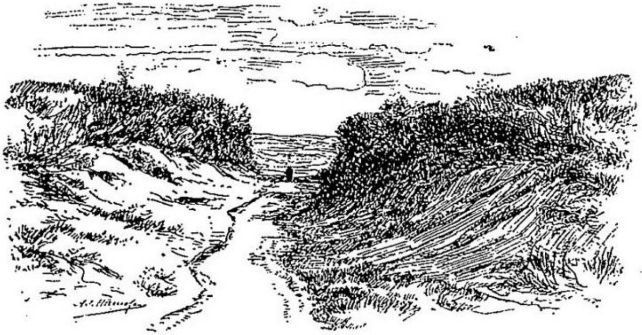
Le chemin creux d'Ohain en 1815.