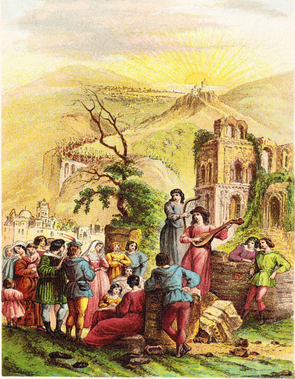
G. Severeys, Chromolith.

TROUVÈRES EXCITANT LE PEUPLE A PRENDRE PART A LA CROISADE.